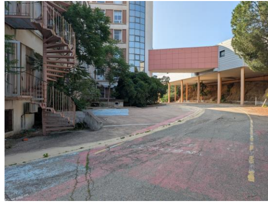
Photo prise sur le site de l'emplacement du camion

L'espace proposé est situé à proximité de l'ancien hôpital, sur une voie fermée à la circulation motorisée, ce qui rend le futur emplacement du camion suffisamment visible pour attirer des clients et laisse un espace suffisant pour l'installation des tables et des chaises.