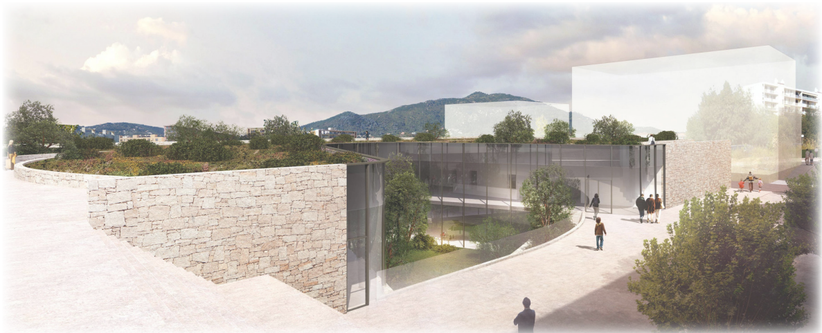
Visuels du chantier et du projet à terme